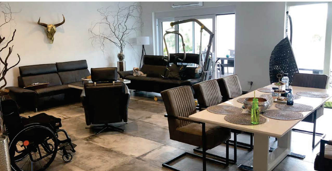
Blick ins neue Wohn- und Esszimmer mit ausreichend Bewegungsflächen.

– dung der Ebenen Anmeldung – Rezeption – Büro – Anpassung von vorhandenen Türöffnungen und – schwellen in allen weiteren Fitnesszonen